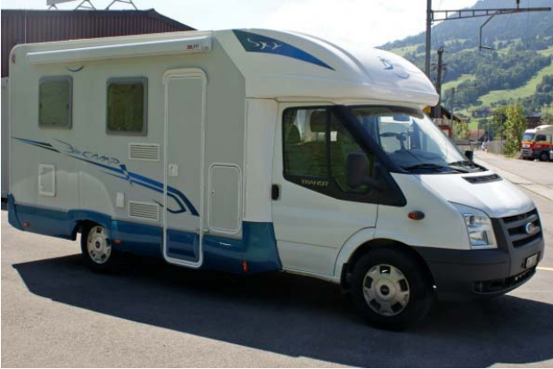
Aussenansicht von vorne