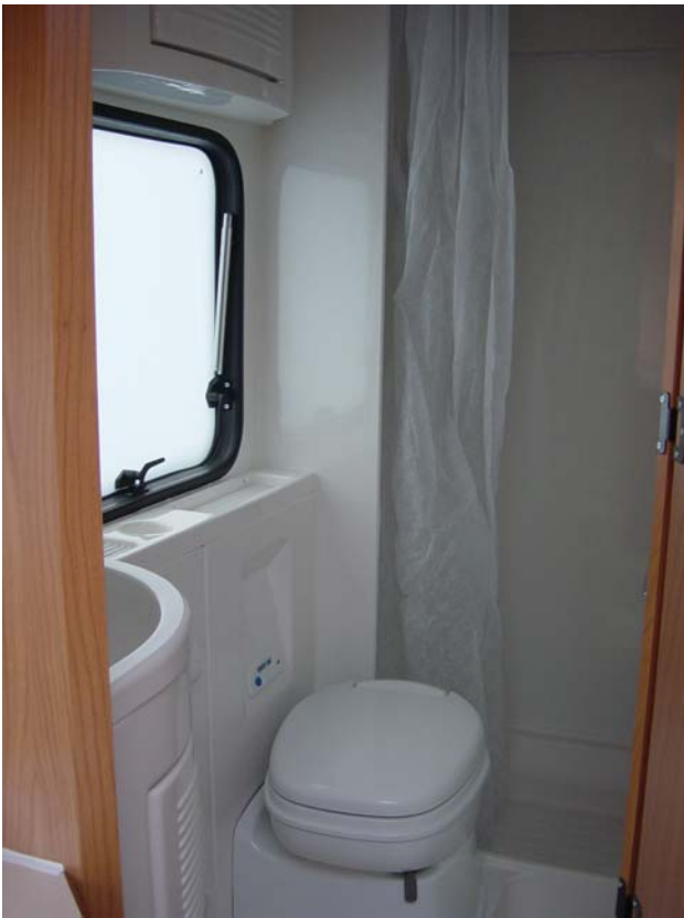
WC und separate Dusche