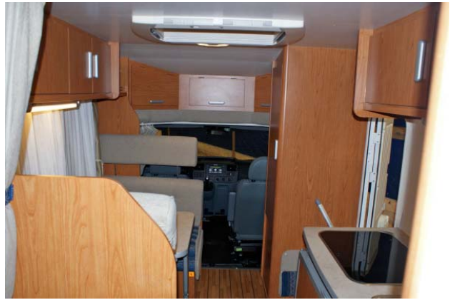
Oberschränke und Dachfenster